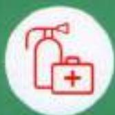
Огнетушитель и аптечка