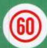
Опознавательный знак «Ограничение скорости»