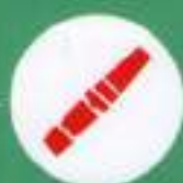
Штатные ремни безопасности