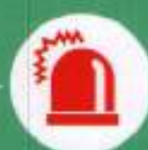
Маячок желтого цвета